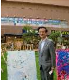
ご協賛いただいた 市川ジェクト社長