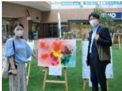
公益財団法人川崎市文化財団からも