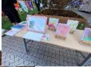
絵画も販売 (売れた)